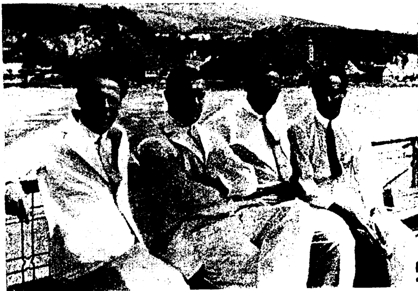
Útban Linz felé...

Korán kelünk. Kezdődik az igazi túra, égünk a vágytól, hogy végre a vámlisztekkel és hajósokkal való szélmalomharcot a Duna árja váltsa fel.