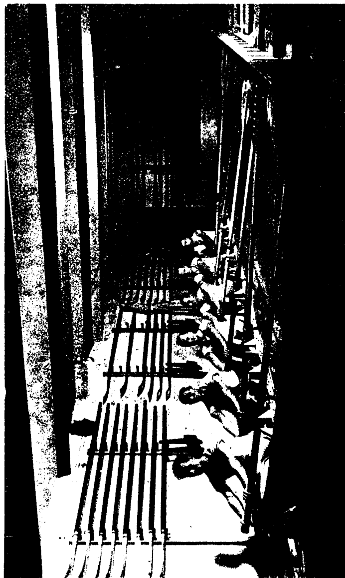
Téli training a Szövelségi Kaszárhelyiségében